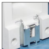
do montażu na szynie TH35