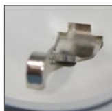
podłączenie przewodu PE od góry (GS16, FS16)