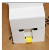
podłączenie przewodów L, N od dołu (GS16, FS16)