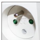
gniazdo typ E