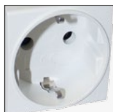
gniazdo typ F (Schuko)