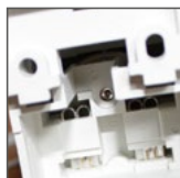
widok tyłu gniazda FS16