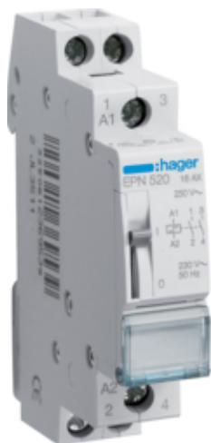
Przełącznik bistabilny 230VAC/110VDC 2NO 16A